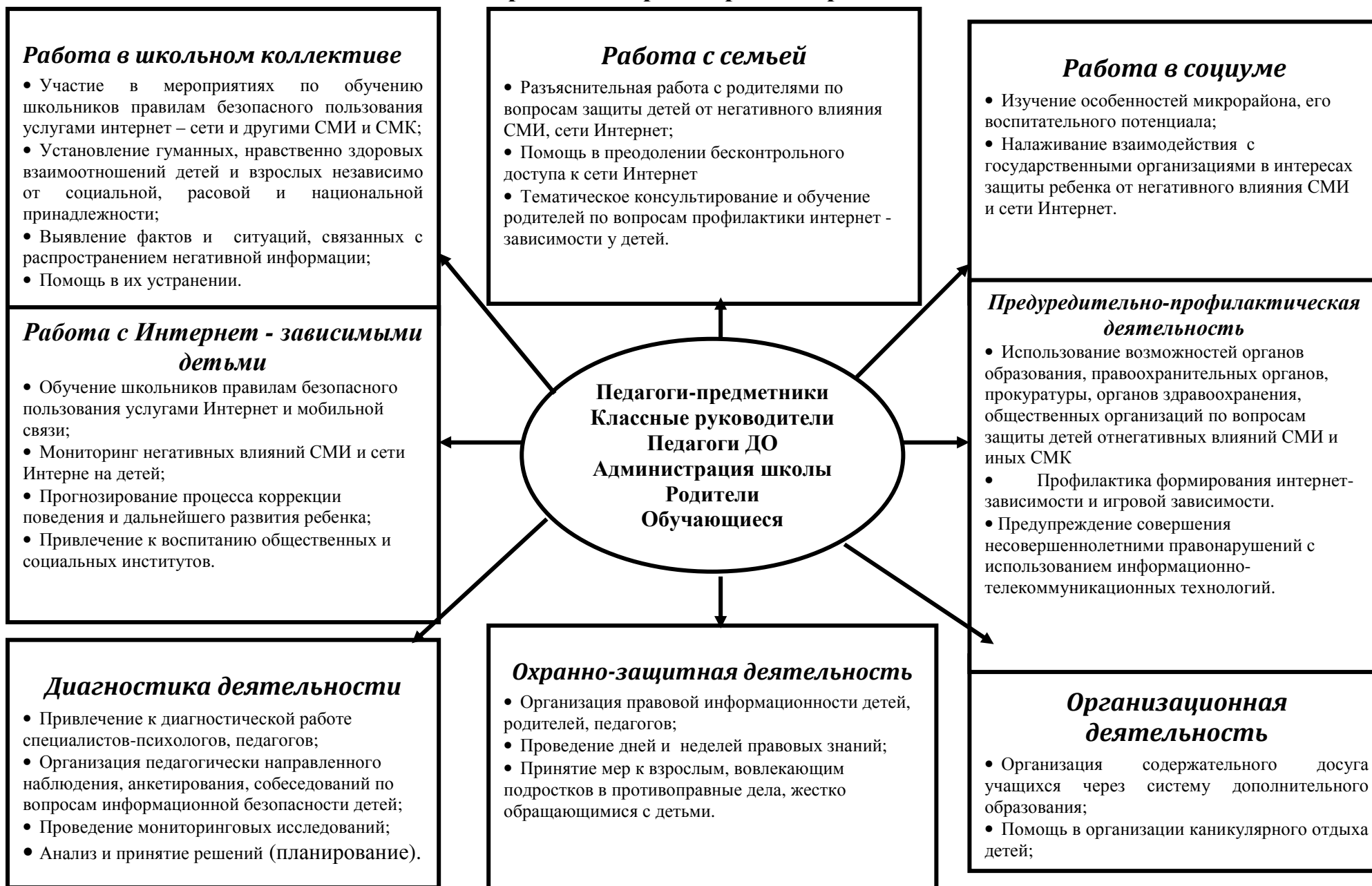
Схема деятельности школы по предупреждению незаконного распространения информации в СМИ и иных СМК, способной причинить вред здоровью и развитию детей