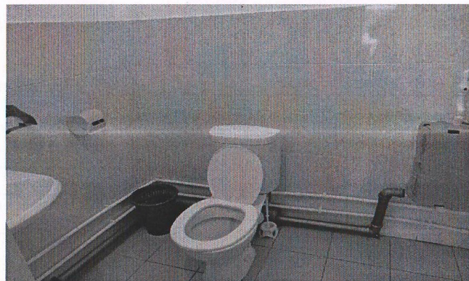
11. Санузел мужской