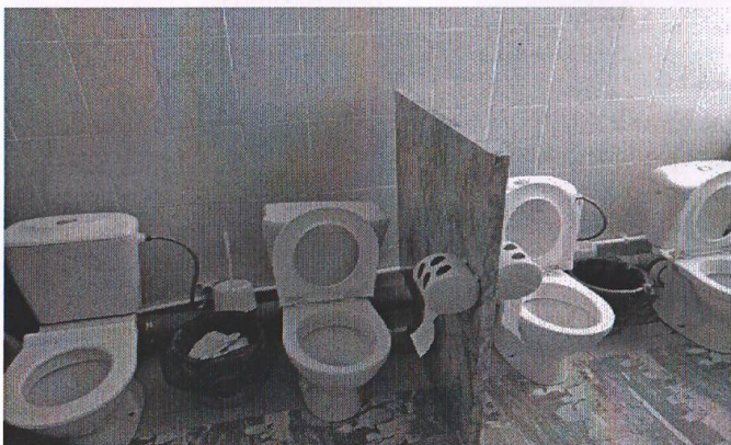
12. Санузел детский сад